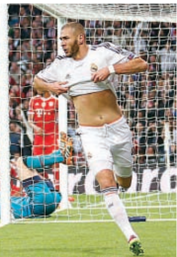
ΠΟΛ ΓΟΥΑΪΤ'ΑΣΟΣΣΙΕΤΕΝΤ ΠΡΕΣ